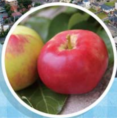
日本一早く実がなる「わらびりんご」