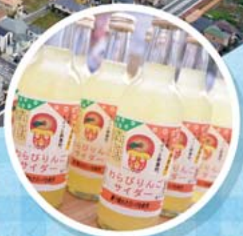
ご当地商品「わらびりんごサイダー」